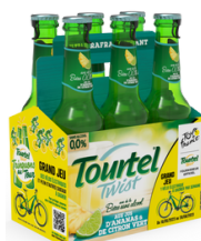
Ananas et Citron vert 4,90€*