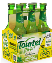
Citron vert et notes de Menthe 4,80€*