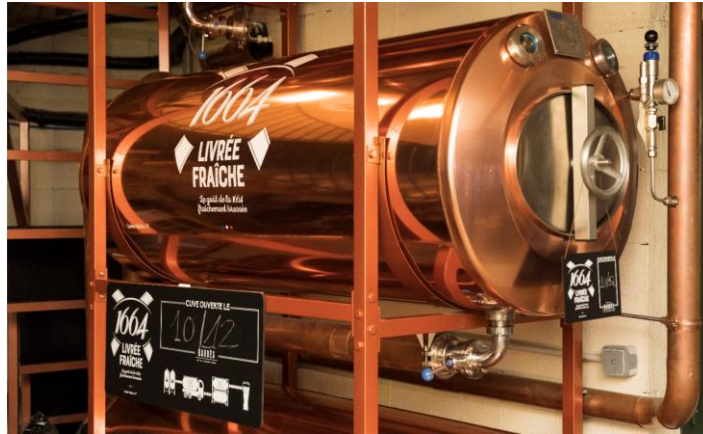
Cuve en inox de 5hl